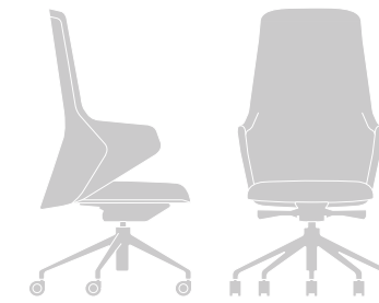
D 60 | W 61 | H 109