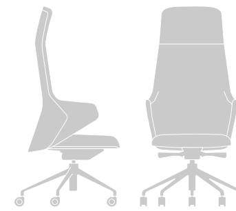
D 60 | W 61 | H 127

The ergonomics of Duet chair complements its contemporary design; generous thicknesses and shapes are balanced with the sleek profile and silhouette, giving the chair visual lightness. The collection includes a tall director chair with headrest, a medium and a short variation, as well as tub and meeting chairs.