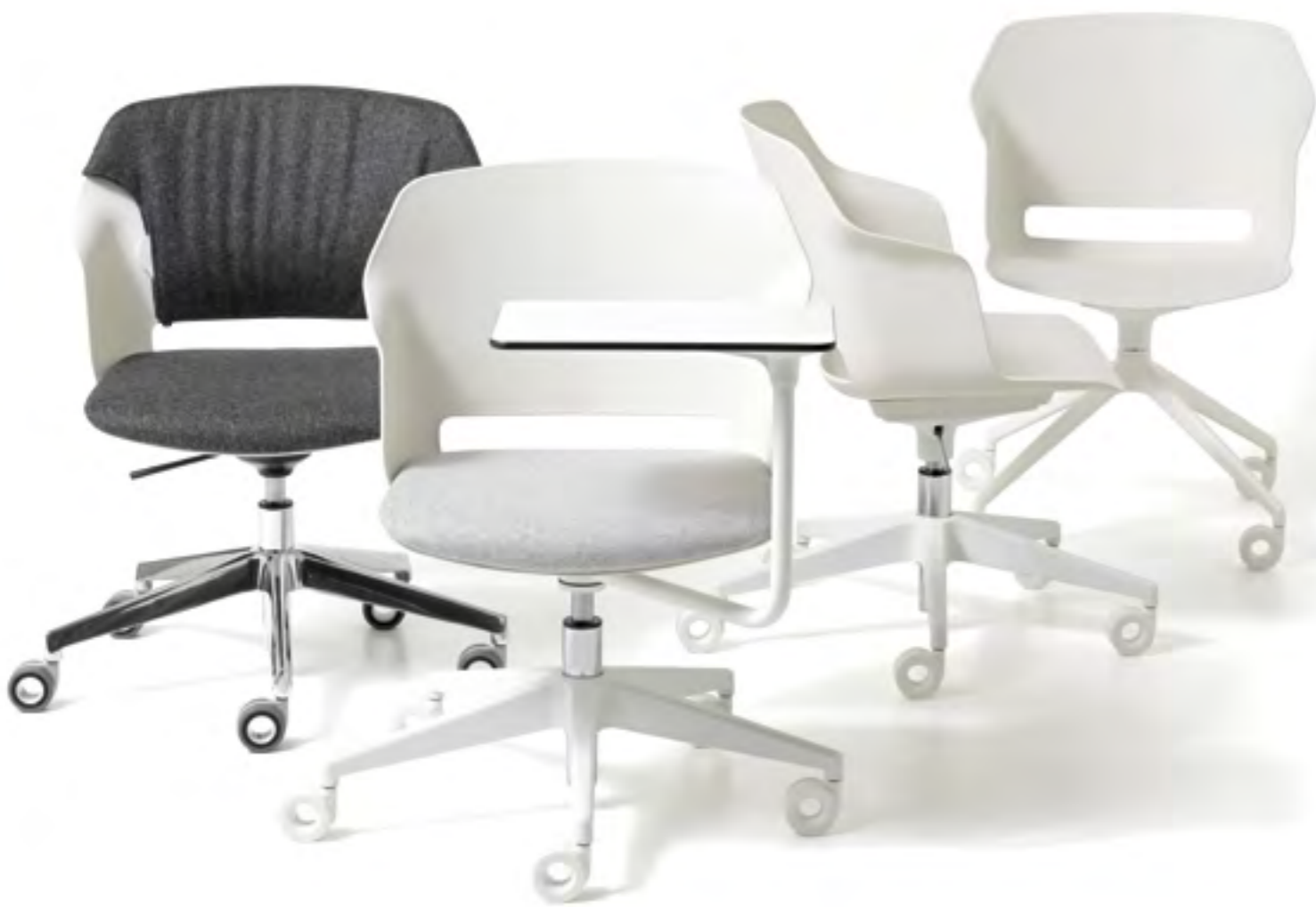
Clop task chair / Blazer CUZ30 - CUZ28 - CUZ39 - CUZ08