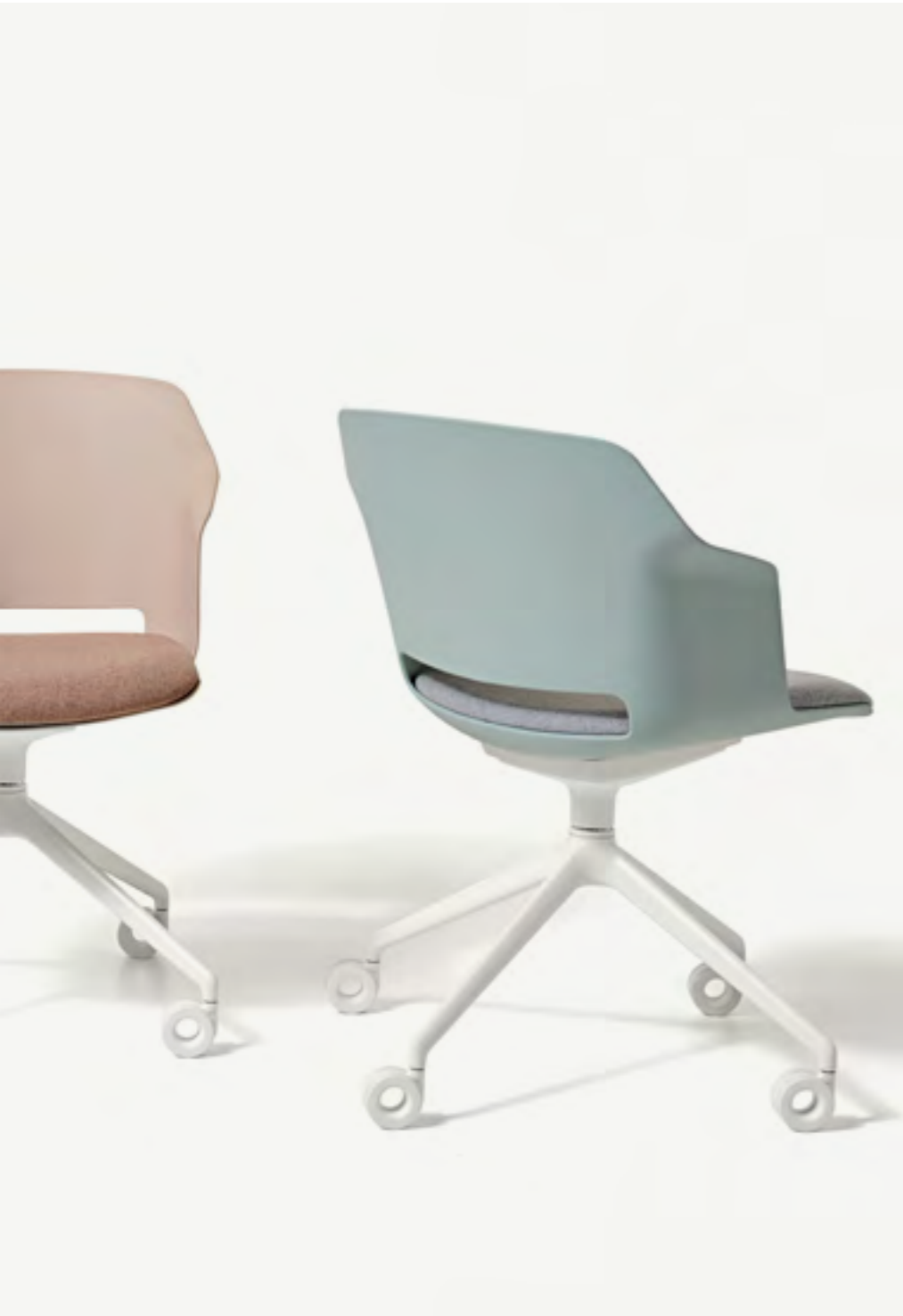
Clop task chair / Wolin 7050.31 - 7050.03