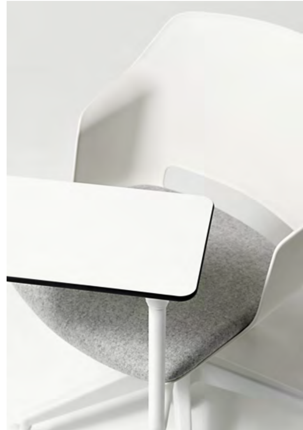
Clop task chair / Blazer CUZ28