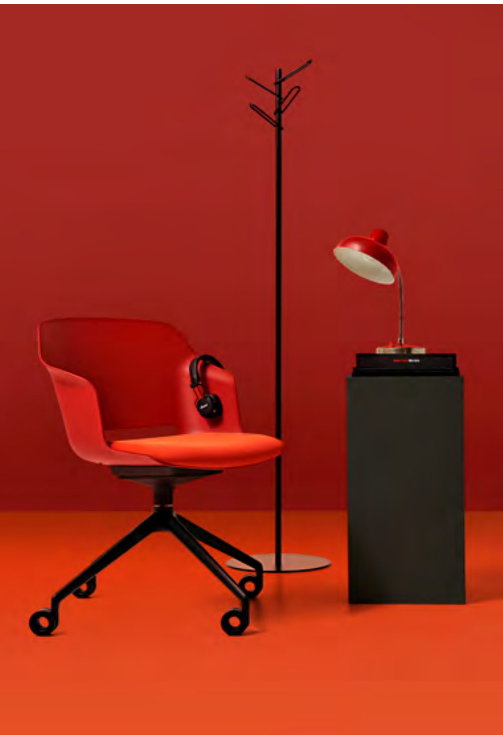
Clop task chair / One 4528