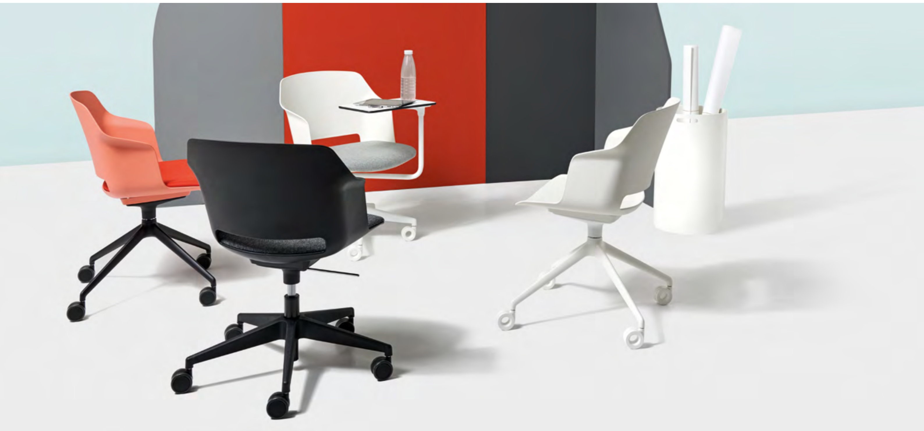
Clop task chair / Blazer CUZ39 - CUZ28 - CUZ08 / Bianco